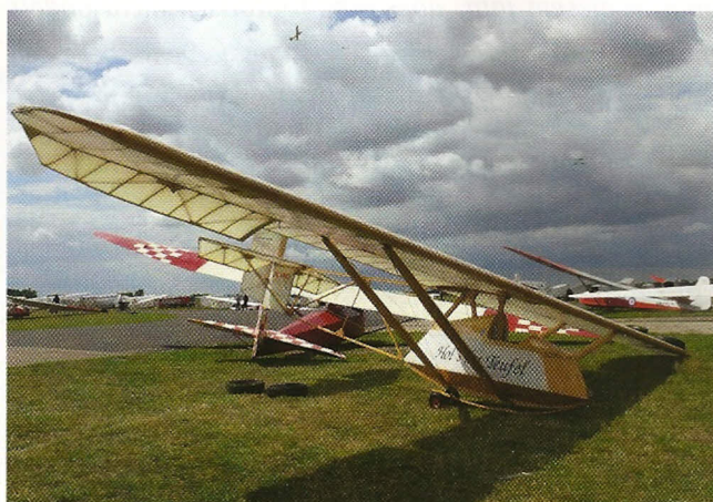
Links: tschechische Zlin Z-24 Krajaneck; oben: Schulgleiter „Hol's der Teufel“

Für die Mitglieder des Vintage Glider Clubs ist die jährliche Rallye ein Höhepunkt im Saisonkalender. Sie findet jedes Jahr Ende Juli bis Anfang August an einem Flugplatz irgendwo in Europa statt. Nach Achmer 2009 war Tibenham in Norfolk das diesjährige Ziel der Oldtimerkarawane. Wer genügend Zeit hat, besucht auf dem Weg zur Internationalen Rallye das sogenannte Rendezvous, das dieses Jahr vom Kent Gliding Club in Challock ausgerichtet wurde